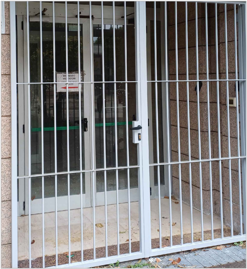
Tipo struttura per cancellate (le ante saranno a doppia cerniera a libro) Questo tipo di struttura andrà presa in esame anche per le inferriate sulle finestre